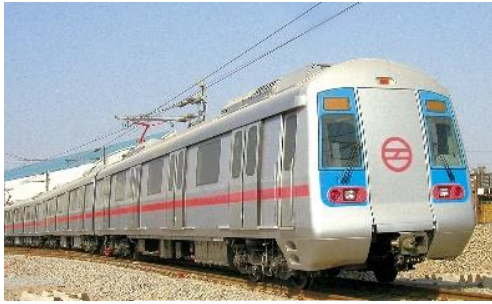
Le métro de Delhi