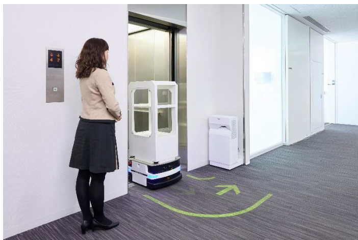
L'éclairage animé indique les mouvements des robots d'intérieur