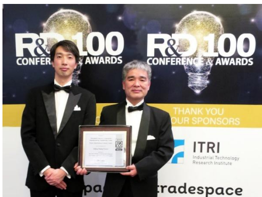
Participants à la cérémonie des R&D 100 Awards

La galvanoplastie est un processus qui met l'élément cible en contact avec une solution de placage via une électrode, sans nécessiter de bain de placage, ce qui permet de plaquer uniquement la surface de contact tout en faisant glisser l'électrode.