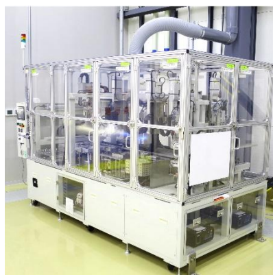
Machine de placage automatique à flux unitaire