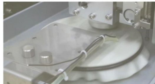
Machine de placage automatique à flux unitaire