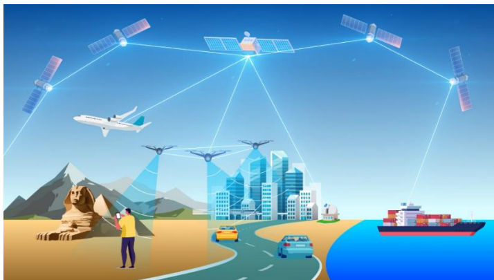
Concept de réseau optique laser fonctionnant dans l'espace pour les communications globales

Cette démonstration rapide et économique utilise un nanosatellite issu d'une collaboration académico-industrielle