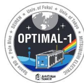
Badge de mission OPTIMAL-1

Les images satellites sont de plus en plus utilisées à des fins telles que l'évaluation des conditions dans les zones dévastées et de l'état des ressources forestières reculées. Les systèmes de communication satellites par ondes radio existants sont limités en termes de capacité, de vitesse et de distance. Par conséquent, de nouveaux systèmes optiques offrant des capacités de communication améliorées sont nécessaires pour effectuer des évaluations plus rapides et à résolution plus élevée depuis l'espace. Les systèmes avancés qui utilisent des signaux laser devraient être de plus en plus répandus, non seulement en raison de leurs capacités de communication supérieures, mais aussi de leurs longueurs d'onde plus courtes que les ondes radio, ce qui permet l'utilisation d'antennes terrestres relativement petites et faciles à installer.