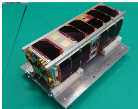
Module OPTIMAL-1 (avec l'autorisation d'ArkEdge Space et de l'université de Fukui)