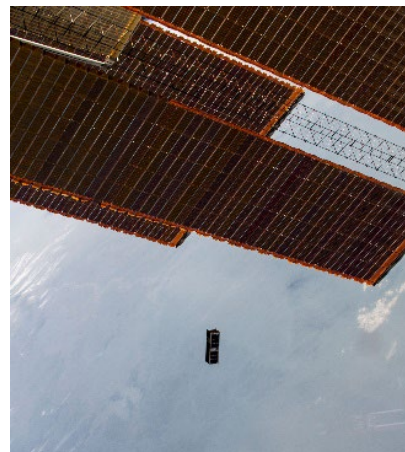
Déploiement d'un nanosatellite depuis la Station spatiale internationale