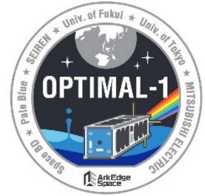
Badge de mission OPTIMAL-1

Les images satellites sont de plus en plus utilisées à des fins telles que l'évaluation des conditions dans les zones dévastées et de l'état des ressources forestières reculées. Les systèmes de communication satellites par ondes radio existants sont limités en termes de capacité, de vitesse et de distance. Par conséquent, de nouveaux systèmes optiques offrant des capacités de communication améliorées sont nécessaires pour effectuer des évaluations plus rapides et à résolution plus élevée depuis l'espace. Les systèmes avancés qui utilisent des signaux laser devraient être de plus en plus répandus, non seulement en raison de leurs capacités de communication supérieures, mais aussi de leurs longueurs d'onde plus courtes que les ondes radio, ce qui permet l'utilisation d'antennes terrestres relativement petites et faciles à installer.